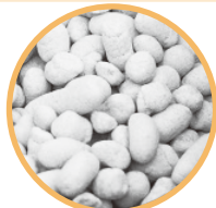
豆つぶ250製剤 (実物大)